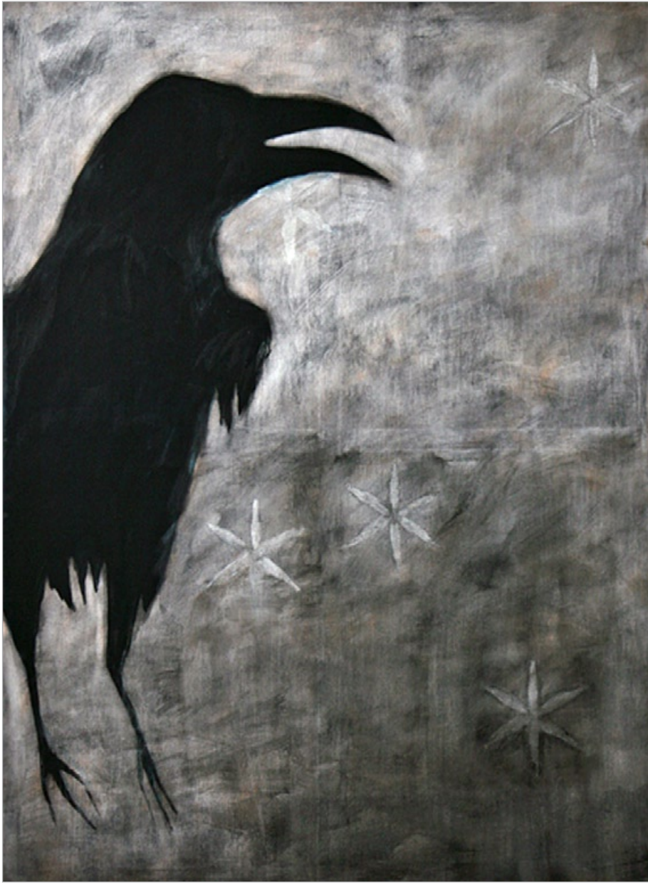
Krajina s ptákem (detail), 2007, kombinovaná technika, 175 x 405 cm