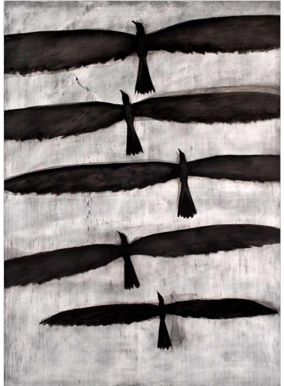
Ptáci (z cyklu Sen o apokalypse), 2006, kombinovaná technika, 200 x 145 cm