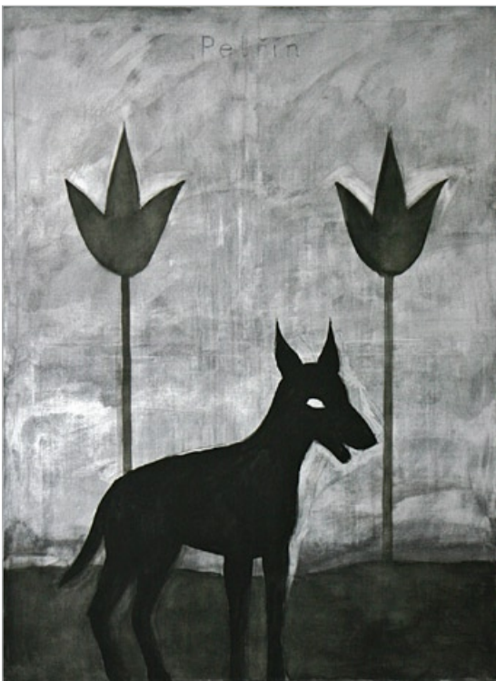
Petřín, 2007, kombinovaná technika, 195 x 145 cm