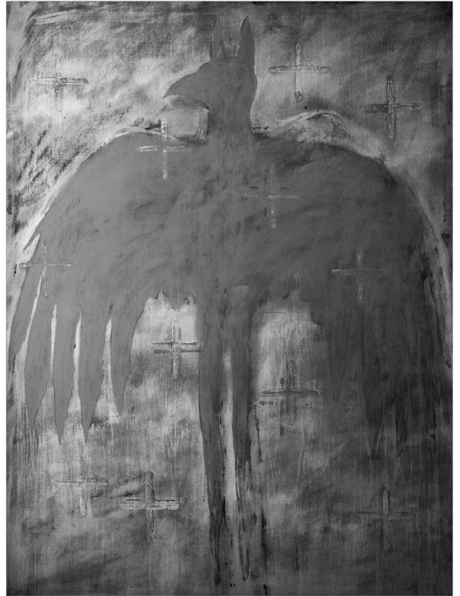
Krajina se žlutým andělem, 2008, kombinovaná technika, 185 x 135 cm