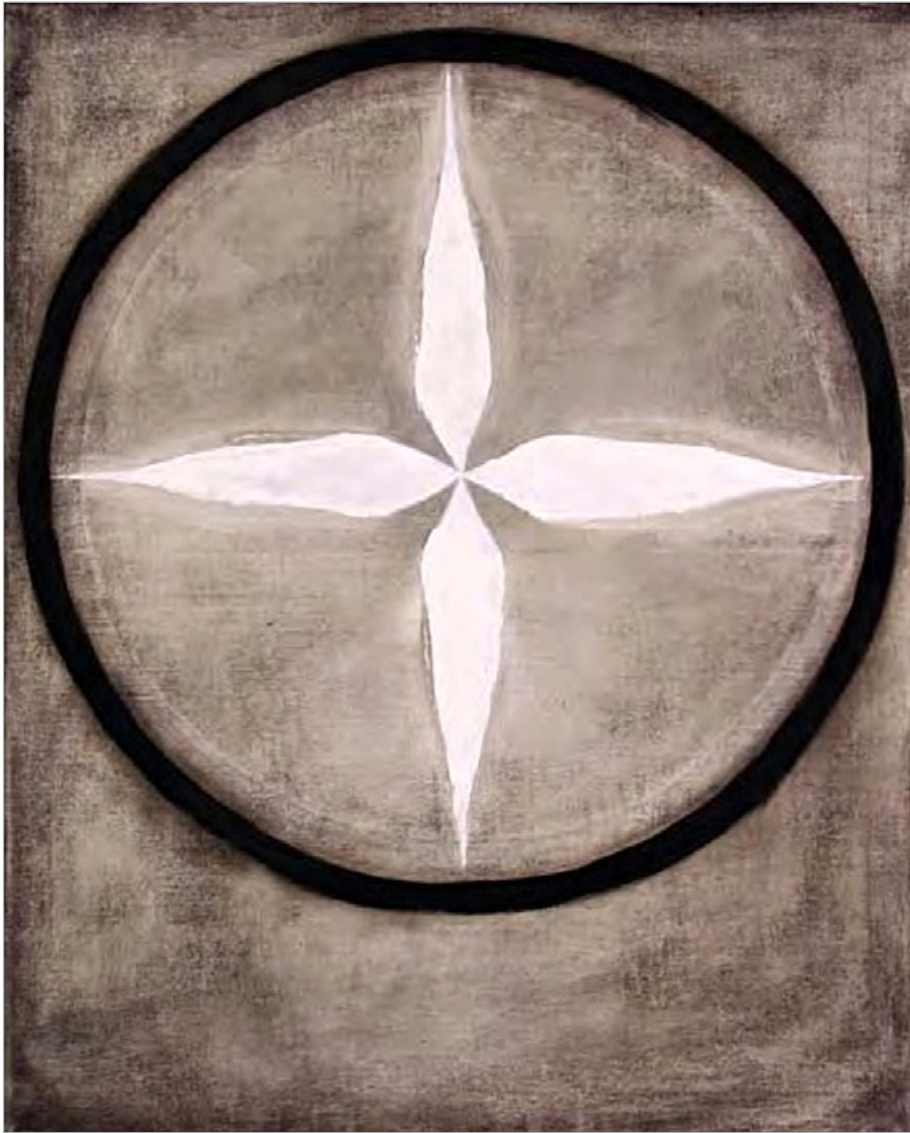
Lemurie II, 2006, olej, plátno, 100 x 80 cm