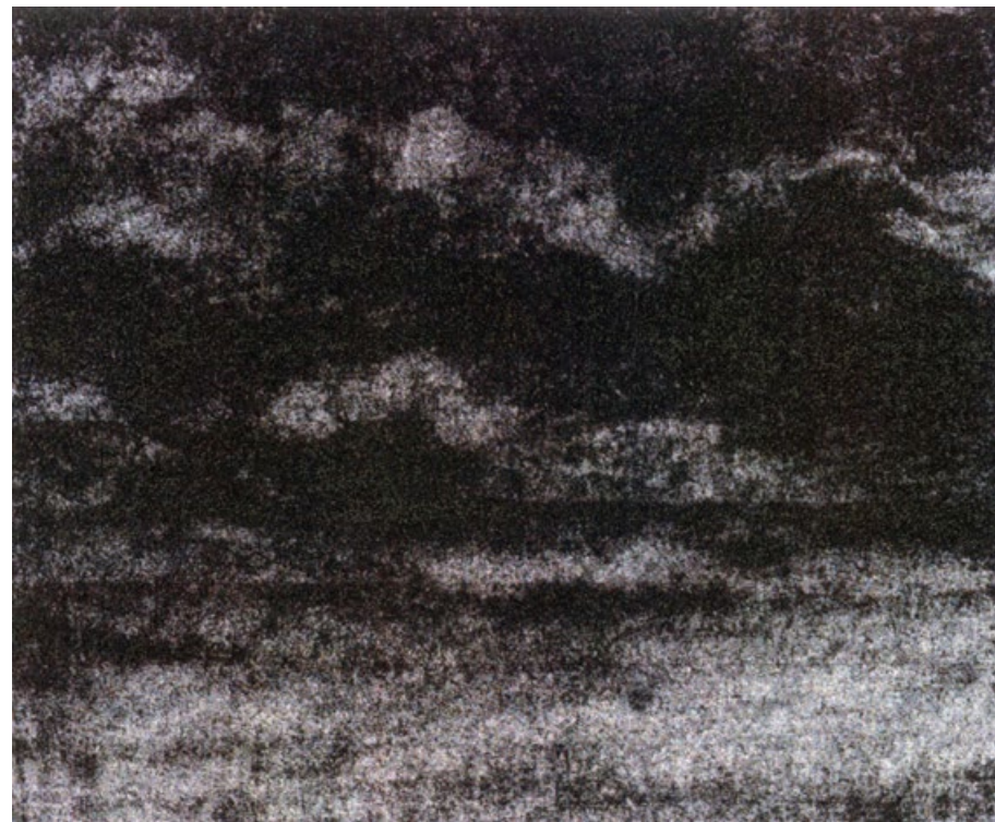
Krajina s mraky, 2006, uhel na papíře, 13,1 x 15,8 cm