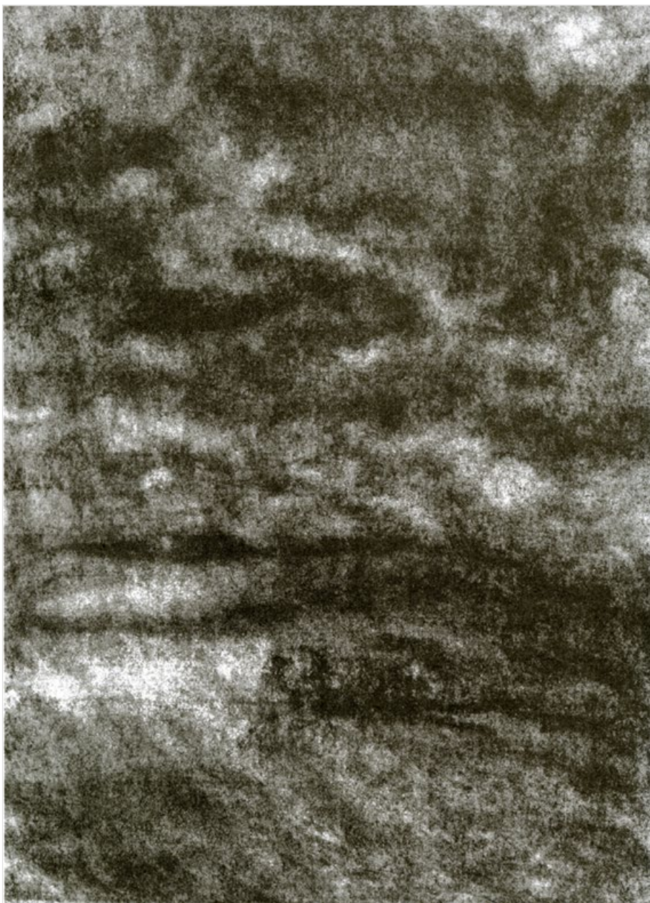
Krajina s mraky, 2006, uhel na papíře, 26,4 x 20,1 cm