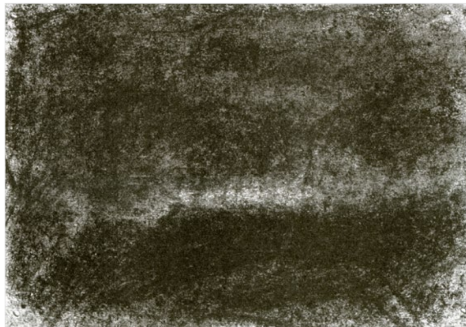
Krajiny s mraky, 2006, uhel na papíře, 10,2 x 14,6 cm