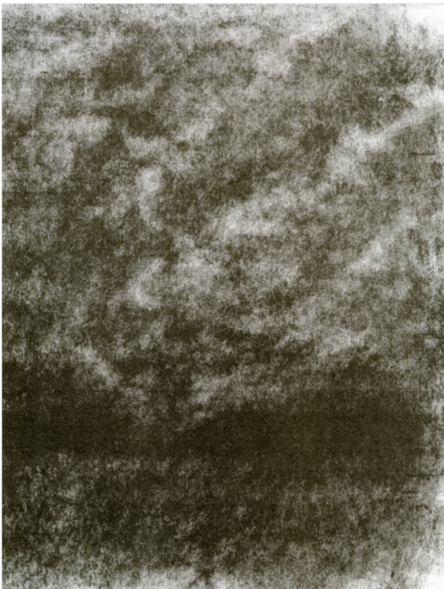
Krajina s mraky, 2006, uhlí na papíře, 26,4 x 20,1 cm