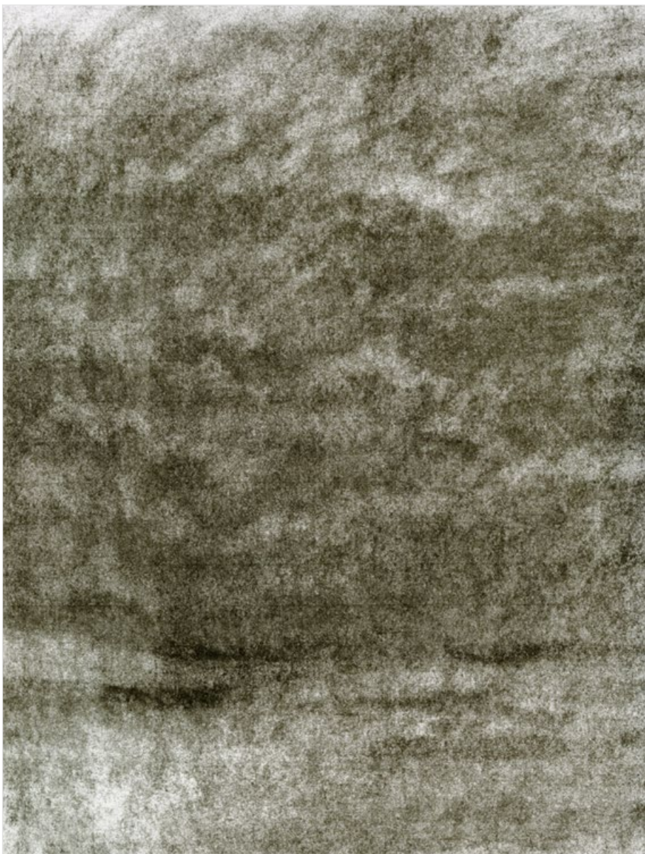
Krajina s mraky, 2006, uhel na papíře, 26,6 x 20,1cm