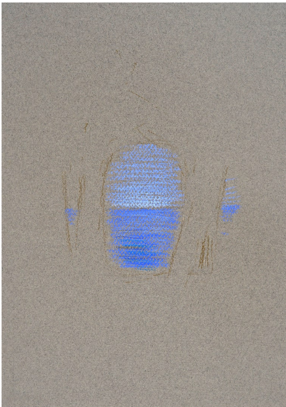
Jezero, 2011, pastel, tmavý papír, 29,5 x 21 cm

„Bezejmenné je prapočátkem nebe a země“ (Lao-C')