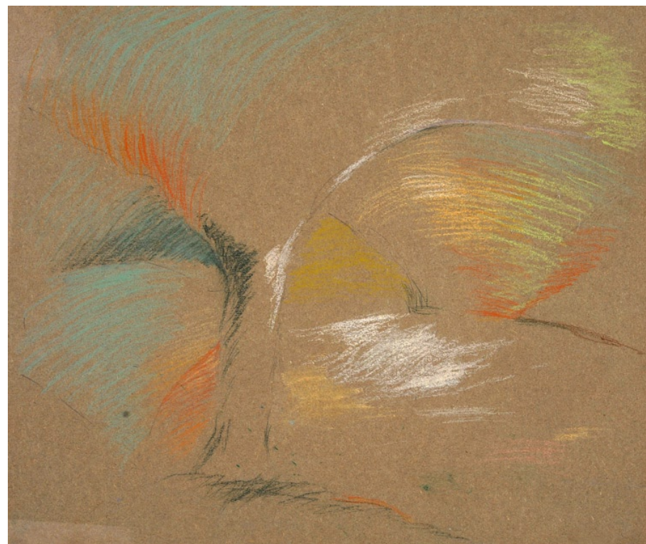
Pod ořechem, 2010, pastel, barevný papír, 26 x 31 cm