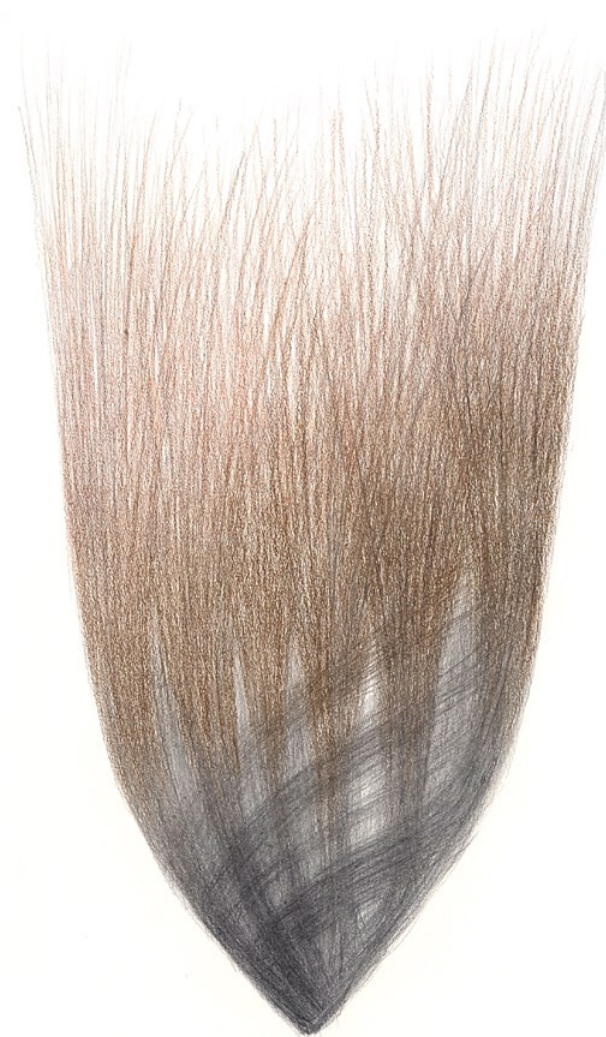
Keř, 2001, pastel a tužka, papír, 100 x 70 cm

„Bezejmenné je prapočátkem nebe a země“ (Lao-C')