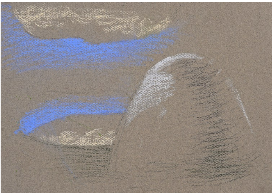
Zrcadlení, 2010, pastel a tužka na tmavém papíře, 21 x 29,7 cm

„Dovnitř k světlu, v kraje jiné, vracíš se jak do vidin“ (G.Trakl)