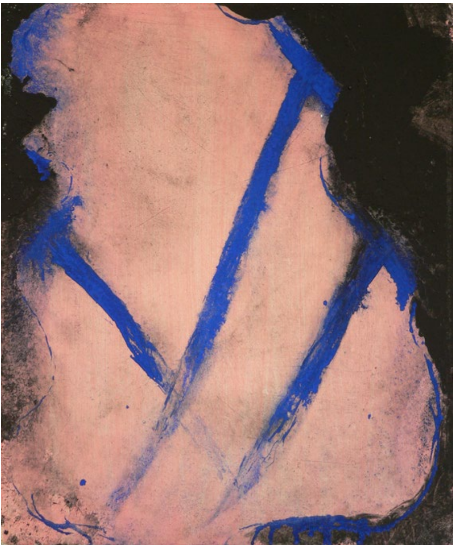
Vzpěry I, 2014, komb.technika na plátně, 30 x 20 cm