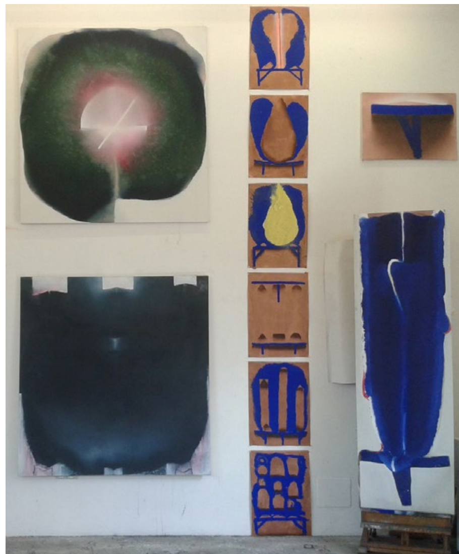
Z ateliéru, 2016