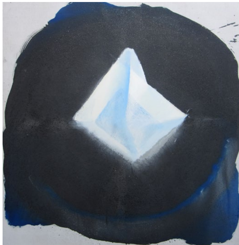
Slánka I, 2014, kombinovaná technika na plátně, 150 x 140 cm

http://artycok.tv/lang/cs-cz/4677/vladimir-vela / www.galerie-sumperk.cz