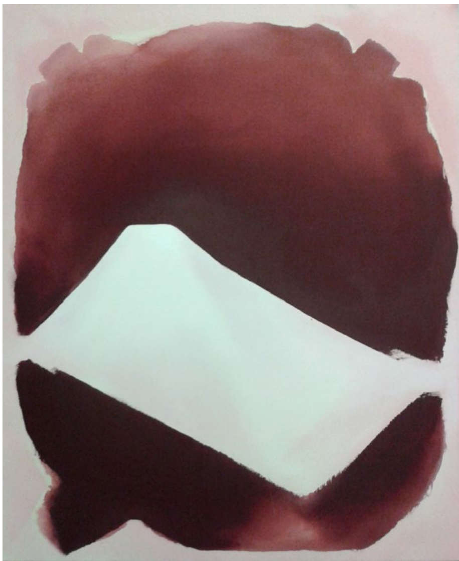
Bez názvu, 2015, akryl a pigment na plátně, 140 x 125 cm

„Obrazy Vladimíra Věly jsou nesmírně dynamické, snaží se o sumární zkratku, ale zároveň obsahují podivnou magii, jejíž dešifrace je obtížná a doslovně určitě nemožná. Právě tato malá závislost na nalezených řešeních je jejich základní kvalitou...“