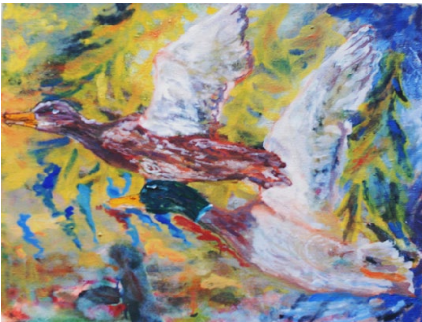
Kačeny, 65 x 85 cm, olej na plátně, 2017