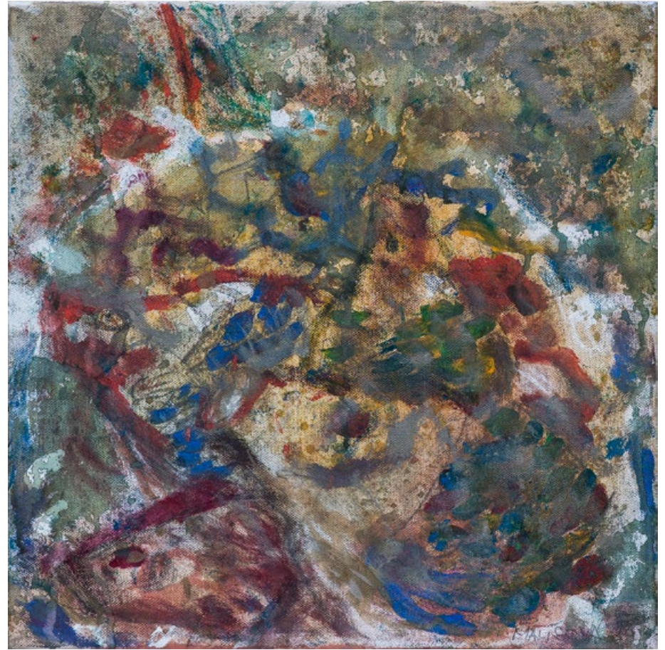
Triptych II, Ryby, 20 x 20 cm, olej na plátně, 2013