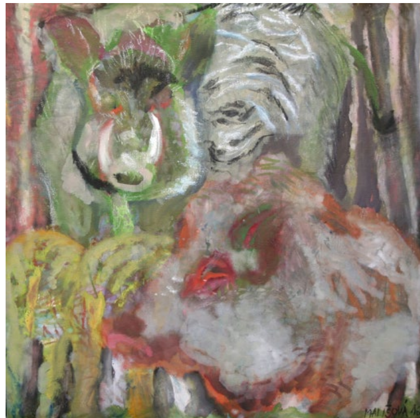
Kanci, 100 x 100 cm, olej na plátně, 2012