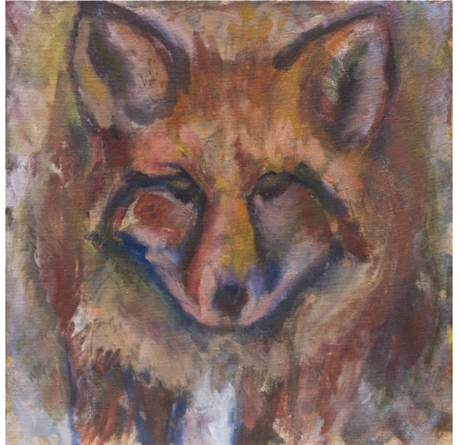
Liška, 65 x 65 cm, olej a pastel na plátně, 2016