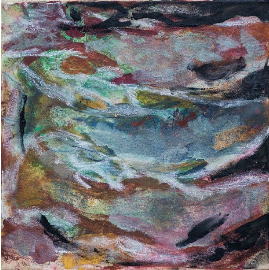
Triptych III, Ryby, 20 x 20 cm, olej na plátně, 2013