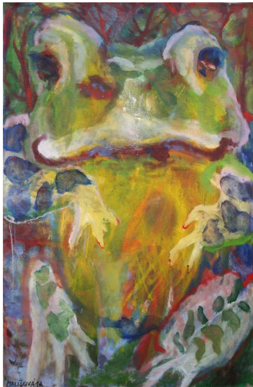
Žabička, 130 x 80 cm, olej na plátně, 2012