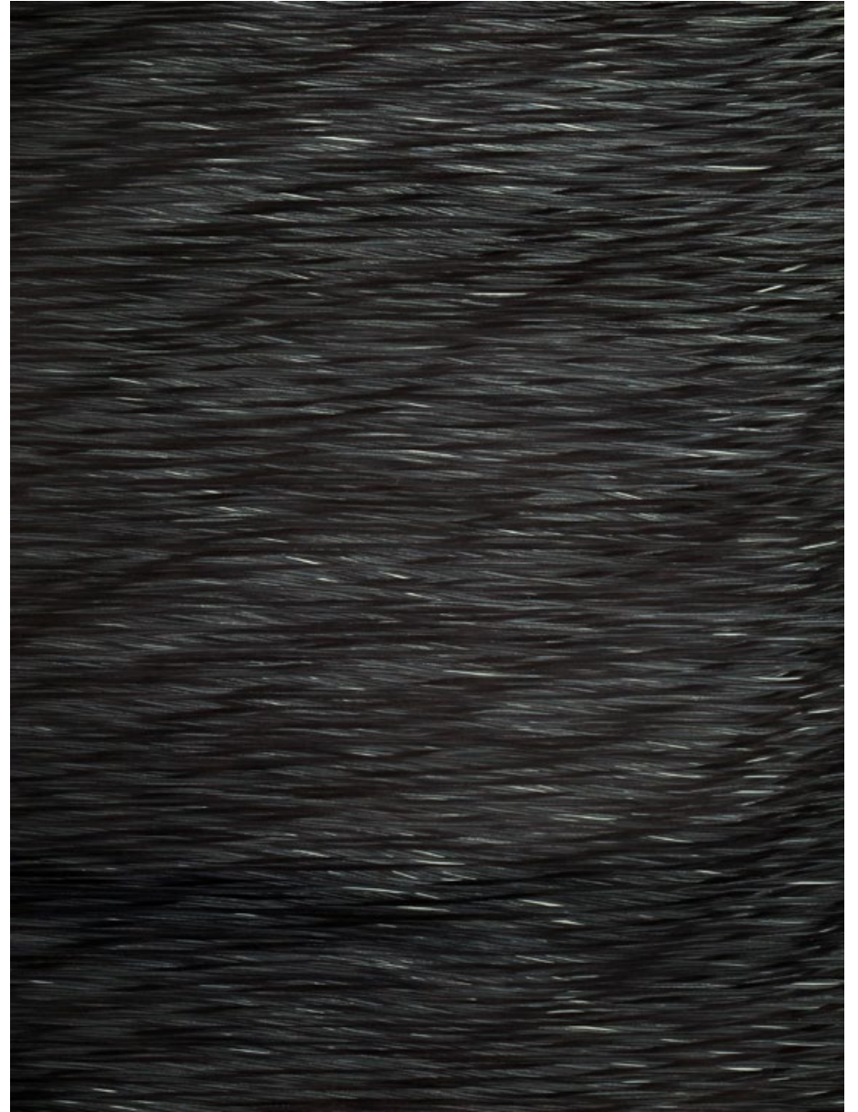
Klidná hladina VI, 2018, fix na papíře, roláž, 210 x 100 cm, výřez