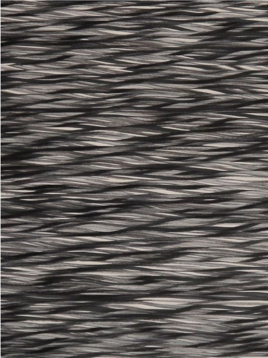
Zčeřená hladina I, 2019, fix na papíře, roláž, 210 x 100 cm, výřez