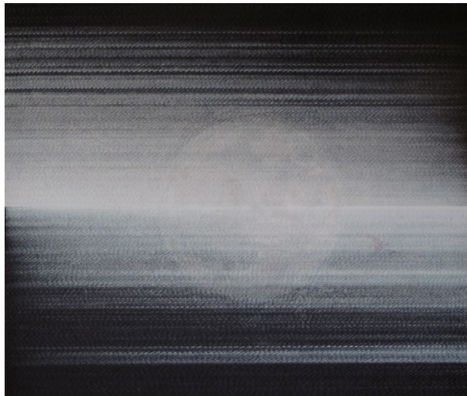
Východ Měsíce (Falešné obzory), 2017, fix na papíře, 151 x 137 cm, výřez