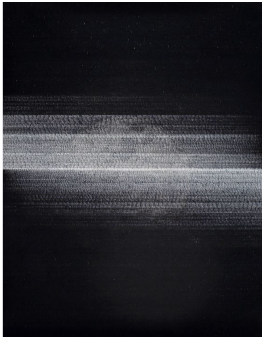
Měsíc je rozlomený, 2016, fix na papíře, 151 x 117 cm