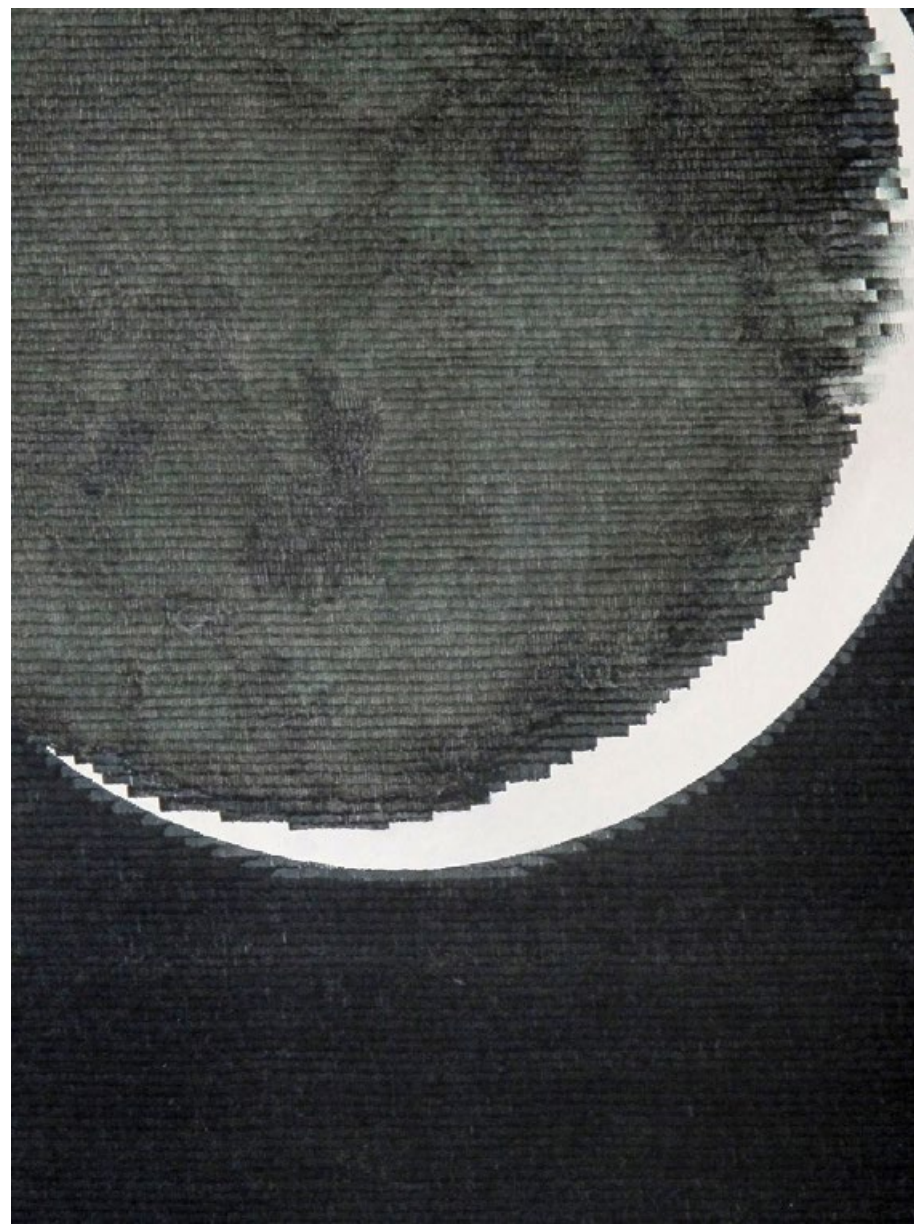
Sivé světlo měsíce, 2021, fix na papíře, roláž, 95 x 70 cm, výřez