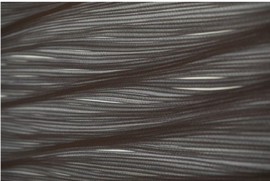
Vlna, 2020, fix na papíře, roláž, 70 x 100 cm